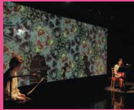
P新人賞2016受賞作品『夜叉ヶ池』(影の色彩ワンプロジェクト/石川県)