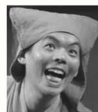
ゴマトダイ 人形劇団あつけらかん代表