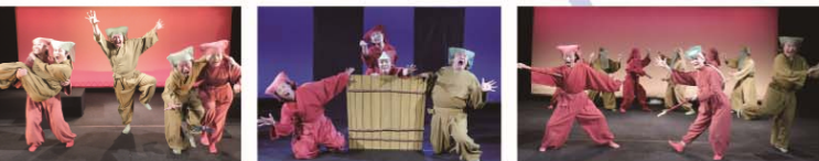
写真/前回公演より

作・演出 座長/石黒 寛 音響/ノノヤママナコ(マナコプロジェクト) 照明/若狭慶太(藤井照明) 美術/小辻賢典(人形劇団むすび座) 音響オペレーター/堀場眼助(マナコプロジェクト) 題字/池田 博 宣伝美術/青山和代 衣装協力/大池かおり 時代横町ホームページ制作/板倉恵三子 協力/人形劇団むすび座・人形劇団パン・板倉歌奈子 愛知県人形劇協会 共催/ひと組・特定非営利活動法人愛知人形劇センター 後援/名古屋市・名古屋市教育委員会 協賛/損害保険ジャパン日本興亜株式会社 企画・制作/ひと組