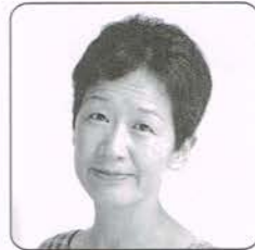
金原祐三子 ケイコ (Japanese ballad singer)