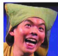
ゴマモトダイ 人形劇団あっけらかん♪代表