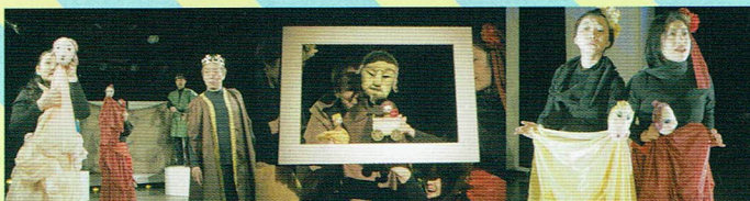
2016年3月『シェイクスピアが笑う夜』より

原作: ウィリアム・シェイクスピア『リア王』| 脚色・演出: ニノキノコスター (オレンヂスタ)| 人形美術・舞台美術: 吉澤亜由美| 作曲: 坂野嘉彦| 照明: 高山 皐月(高山一族)| 音響: 堀場助助(マナコプロジェクト)| 舞台監督: 柴田頼克 (かすかひ創造庫)| 演出助手: スズキカズマ(オレンヂスタ)| 宣伝美術: オレンヂスタ 美術部| プロデューサー: 中康彦(損保ジャパン日本興亜人形劇場ひまわりホール)