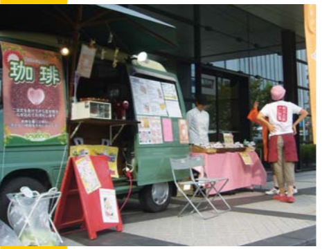
観るだけでなく、食べる・飲むも「フェスティバル=お祭り」には付き物!