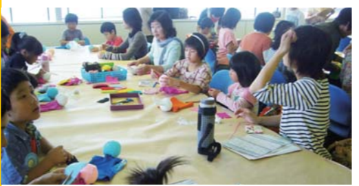
人形劇制作を様々な形でプチ体験できる「ワークショップ」も全国的に盛況。

そこで今号は、各地の誇る人形劇フェスをマップにして一挙ご紹介。気になるフェスを見つけたら、旅行気分ですべてかけてみてませんか?