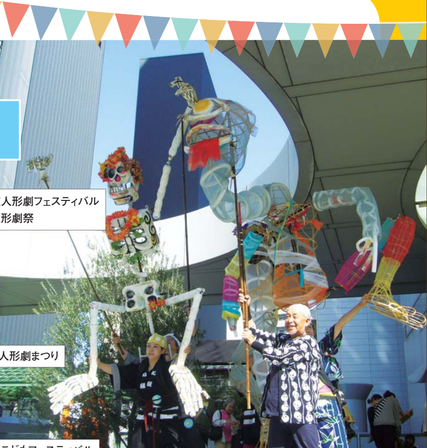
ひまわりホールパペットフェスティバル2014(現・ひまわりホール子どもアートフェスティバル)の様子。屋外でもパフォーマンスが行われ、街にも祝祭性を与えています。