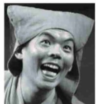
ゴマトダイ 人形劇団あつげらん♪代表