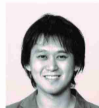
ヤマトヒロ くりくりワールド