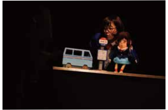
P新人賞2020受賞作品「あの日から彼はわたしのことをしげると呼ぶようになった」(劇団野らほう/松本市)

人形劇ジャンルの明日を担う斬新な才能を発掘するため、今年で11回目の開催となります。受賞作品には賞金20万円を贈呈。さらに2022年度にひまわりホールで新作を招待上演していただきます。